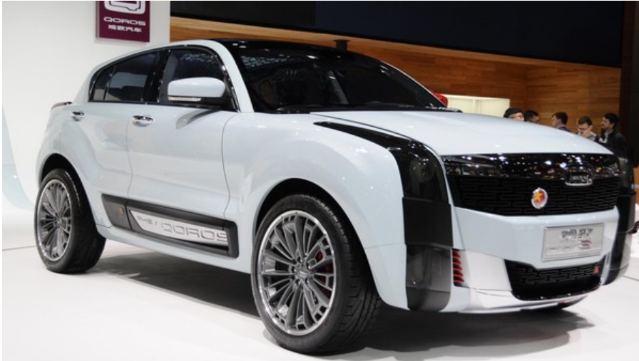
点击图片进入下一页