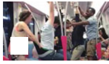
地铁内2外国女当众“荡秋千” 狂拽男子内裤