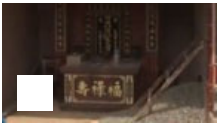
男子修墓地被离奇夺命 长叹一句话后倒地